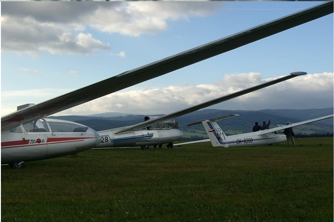
Das war noch im 2009 als die Blanik`s fliegen durften