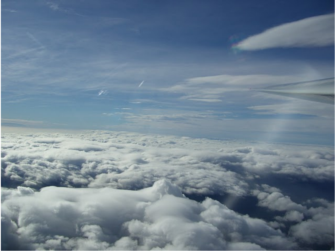
Mit der SF-27 HB-3157 in der Welle von Jeseník