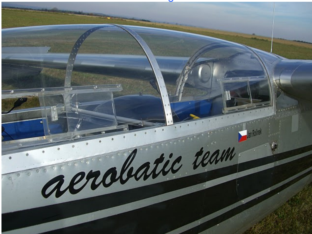
Da schlägt jedes Herz eines Blanik Fan`s schneller !