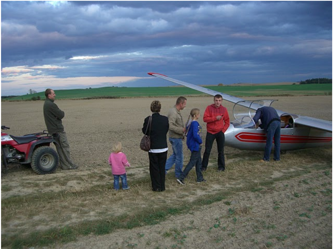
Aussenlandung in Polen