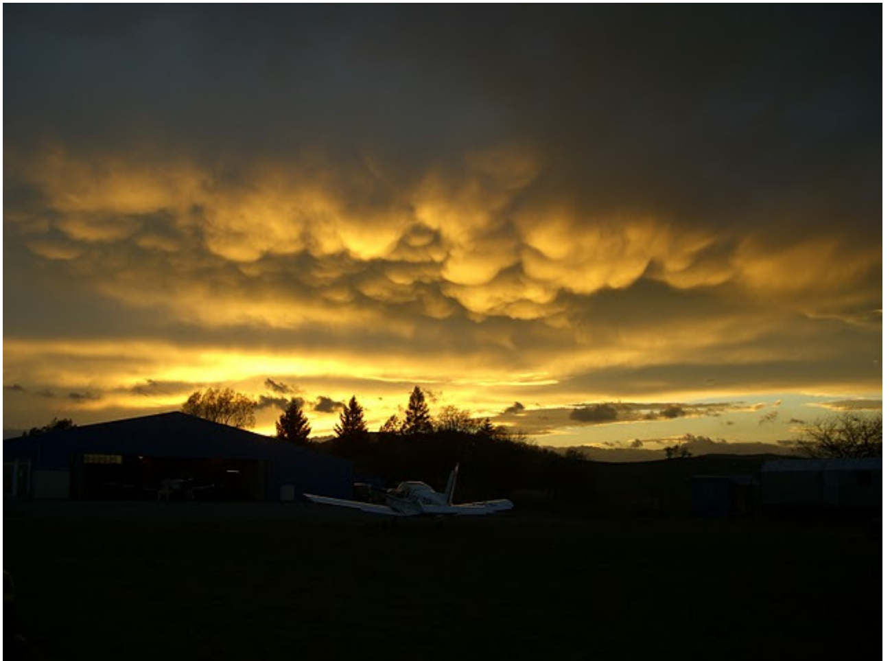
Abendstimmung auf dem Flugplatz