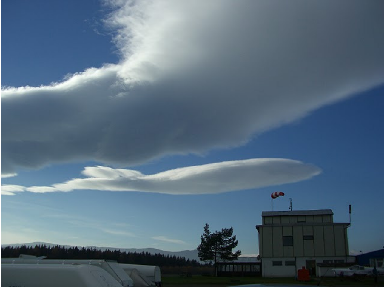
Eine Augenweide für jeden Wellenpiloten morgens um ca.06.30 Uhr